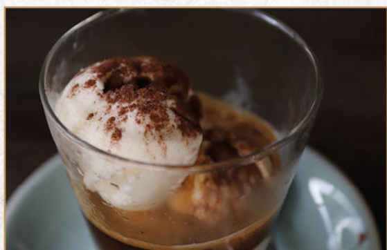
AFFOGATO AL CAFFÈ