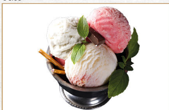
GELATO MISTO - 3 GUSTI