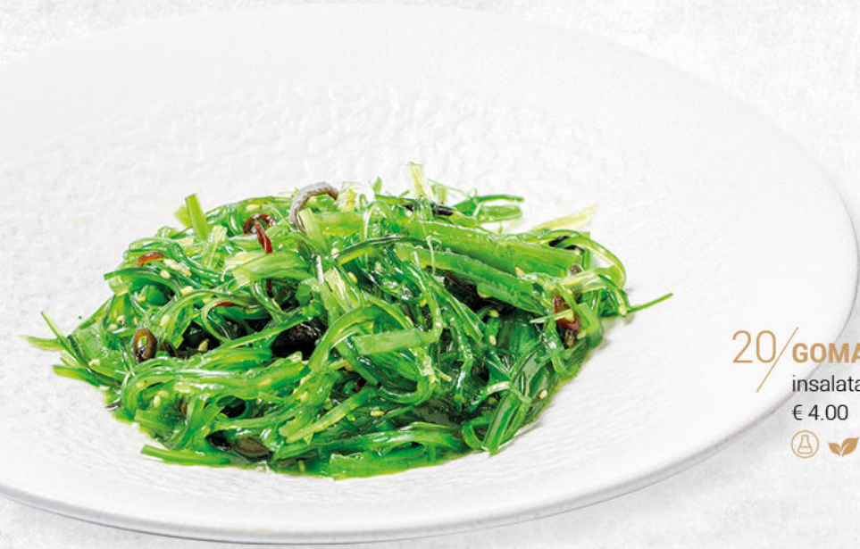
20/ GOMA WAKAME* insalata di alghe giapponese € 4.00 Ⓐ 🌿 🌿