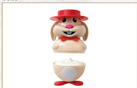
RABBIT GELATO AL FIOR DI LATTE