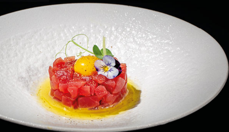
319/SPECIAL TUNA TARTARE

tartare di tonno con uova di quaglia, olio di tartufo, pepe nero e salsa lime e olio d'oliva