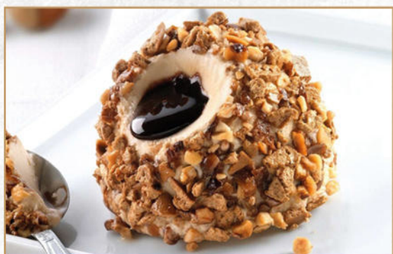
TARTUFO ALLA NOCCIOLA