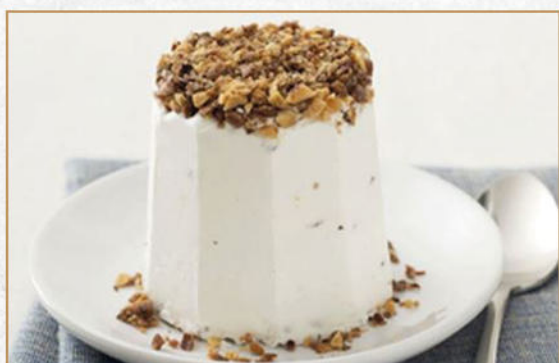
SEMIFREDDO AL TORRONCINO