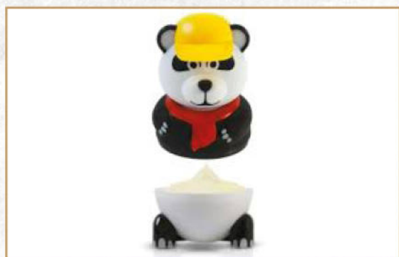
PAN DAN GELATO ALLA VANIGLIA