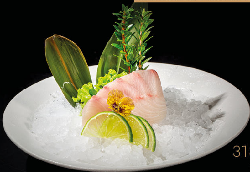
318/SASHIMI DI RICCIOLA

POSSIBILE ORDINARE DAL S01 AL S21 SOLO DUE PIATTI A PERSONA