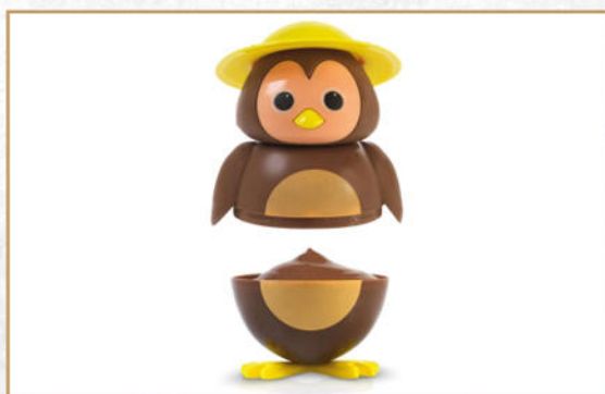
CIP CIOK GELATO AL GIOCCOLATO