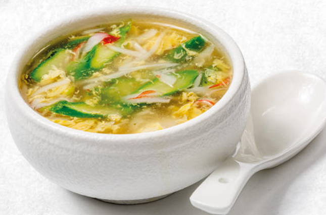
24/ZUPPA ASPARAGI uova, surimi di granchio* e asparagi € 5.00 🌿🍳🍲