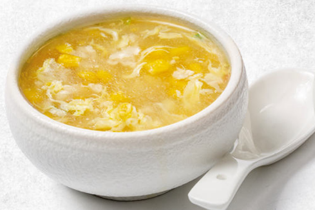
26/ZUPPA POLLO E MAIS uova, pollo e mais € 5.00 🌿🍲