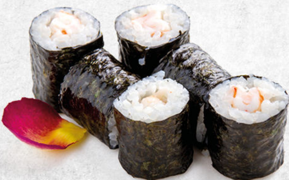
94/EBI MAKI gambero* cotto € 4.50 Ⓟ