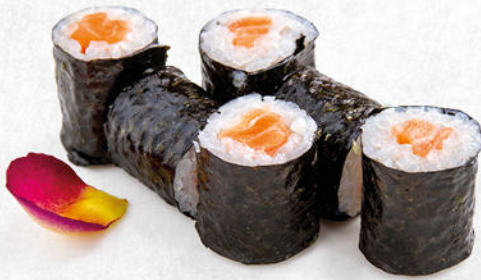
90/SAKE MAKI salmone crudo € 4.50 Ⓟ