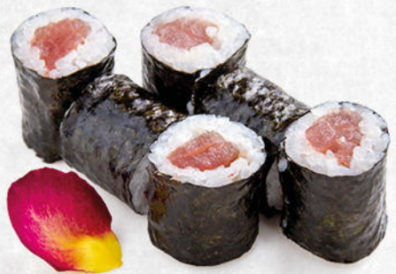
91/TUNA MAKI tonno crudo € 4.50 Ⓟ