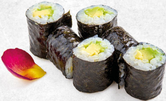
92/AVOCADO MAKI € 4.00 🌿