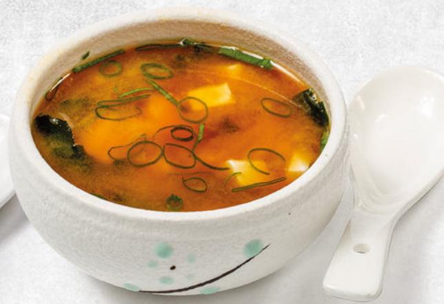
27/ZUPPA DI MISO miso con alghe, tofu ed erba cipollina € 4.00 🌿🍲🌱