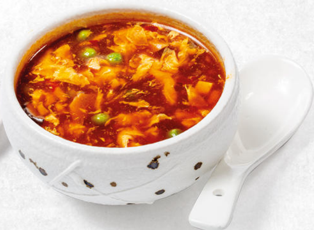
25/ZUPPA PECHINESE zuppa agropiccante con funghi, uova, piselli, pollo e tofu € 5.00 🌿🍲🍳🌶️