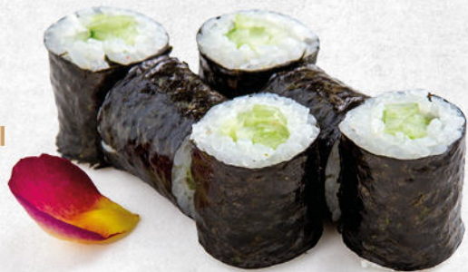
93/KAPPA MAKI cetriolo € 3.50 🌿